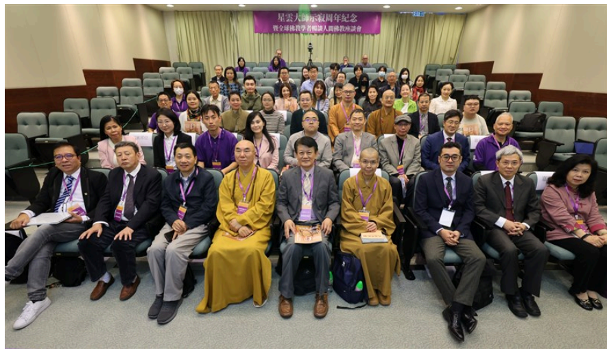
星雲大師示寂周年紀念 暨全球佛教學者暢談人間佛教座談會，於1月19至20日在香港中文大學馮景禧樓和網絡同步舉辦。

【人間社記者陳肯香港報導】在星雲大師圓寂一周年之際，「星雲大師示寂周年紀念——暨全球佛教學者暢談人間佛教座談會」，於1月19至20日在香港中文大學馮景禧樓和網絡同步舉辦，由香港中文大學人間佛教研究中心、北京大學佛教研究中心、中國人民大學佛教與宗教學理論研究所、佛光山人間佛教研究院合辦。來自英、美、澳洲、新加坡、日本、韓國、馬來西亞、泰國、越南及中國大陸、台灣、香港、澳門等13個地區/國家的32位學者、現場及網絡近800觀眾共同追思佛光山開山星雲大師一生為全球人類社會所做的貢獻。